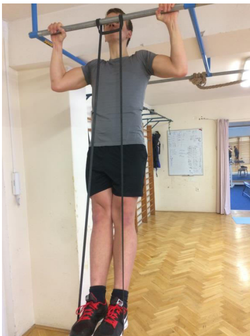
Obr. 3: Brzdívá metoda z horní stabilizované polohy

Problematika je mnohem širší a přesahuje možnosti tohoto krátkého informativního článku. Pokud ovšem budete mít zájem dozvědět se více o správném nácviku, či budete chtít znát další průpravné cviky, neváhejte mě kontaktovat.